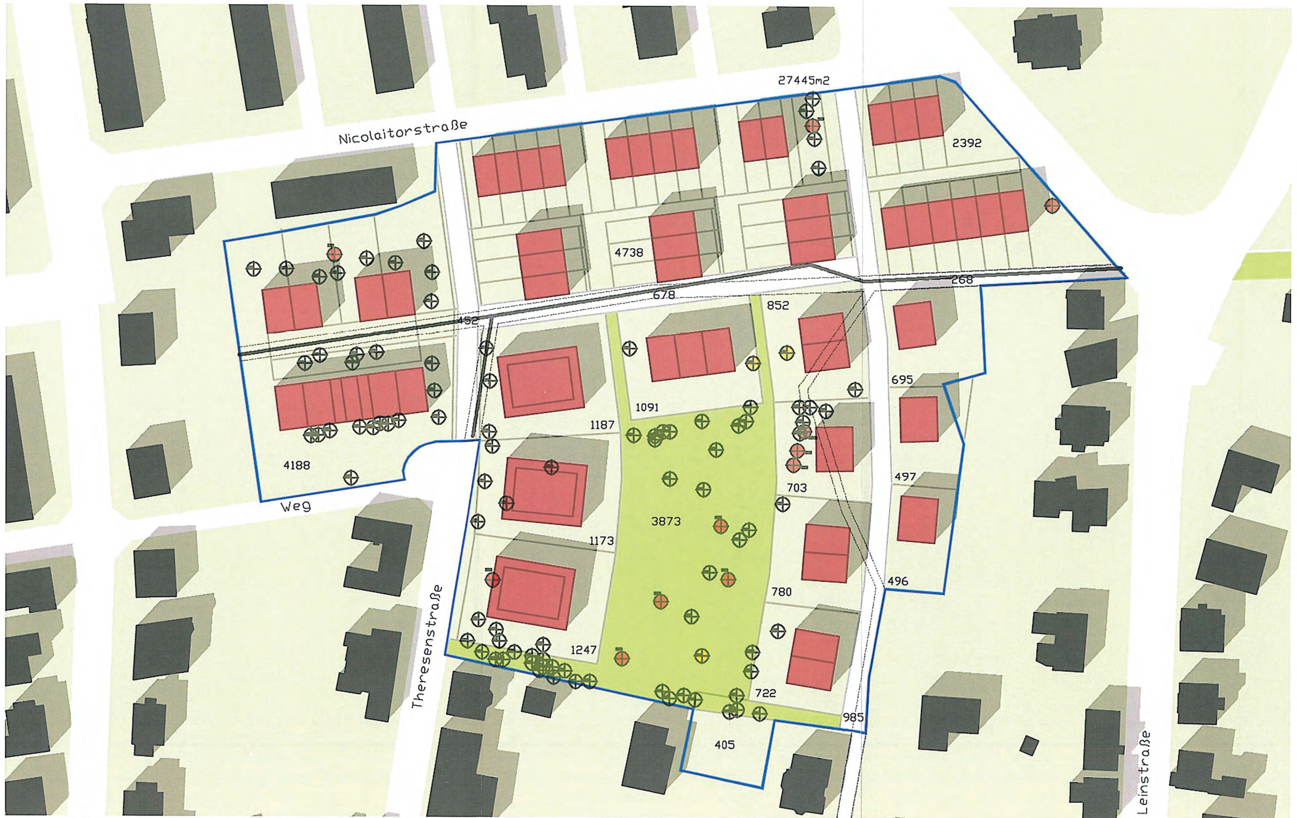
BAUMSTANDORTE M 1:1000