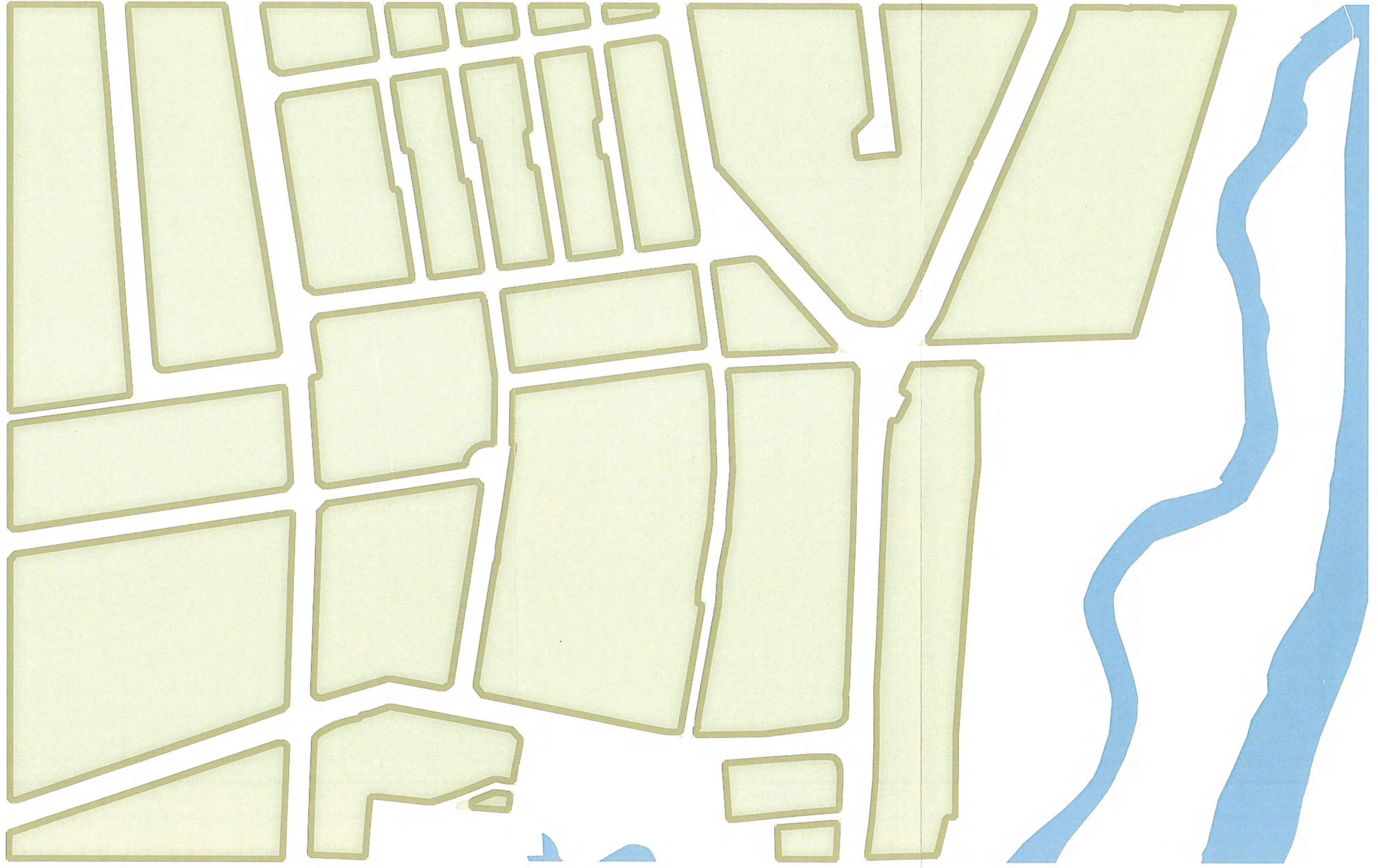
BLOCKSTRUKTUR M 1:2000