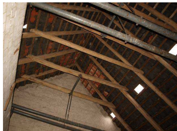
Möglicher Hangplatz im Alten Werkhof – Geb. 16 von