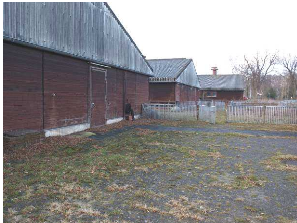
Ställe im Alten Werkhof ohne Befunde (Februar 2014, März 2015) – keine Kotpuren unter der Verkleidung