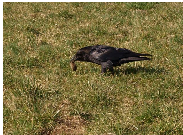
Kolkrabe mit Feldwühlmaus im März 2014 – Feldflur nördlich zum Alten Gutshof