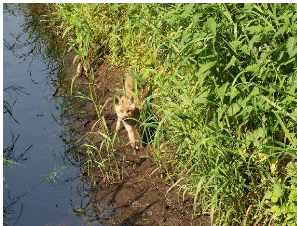
Graben am Nordrand zum Alten Gutshof (Anfang Juni 2014) mit Jungfuchs auf Jagd