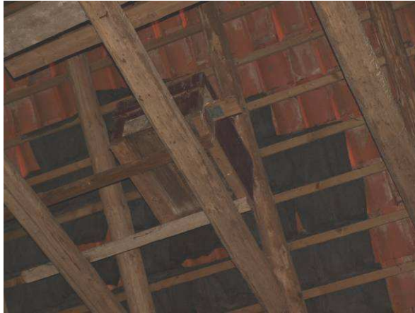
Wechselquartier - Schleiereulenkasten im Alten Werkhof – Geb. 16 – im März 2015 belegt