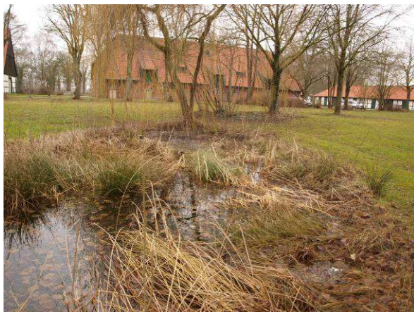
Kleiner Zierteich im Alten Gutshof (März 2014)

Reptilien wurden bei der Untersuchung auf Amphibien nicht auffällig. So wären z.B. Zauneidechsen denkbar im stillgelegten Alten Werkhof bzw. Vorkommen der Ringelnatter im Umfeld von Gräben und Teichen.