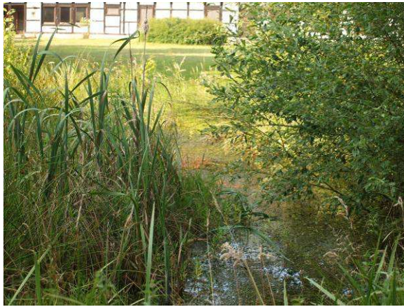
Zierteich im Alten Gutshof (Ende Juni 2014)