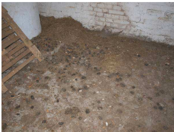
Exkrememente und Gewölle der Schleiereule auf mehreren Dachböden (2014, 2015) - Fledermausprädatator