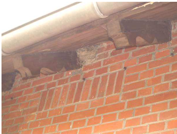
Mehlschwalbenkolonie im Alten Werkhof am Geb. 15 – in 2014 mit ca. 20 Brutpaaren von 70 Nestern belegt