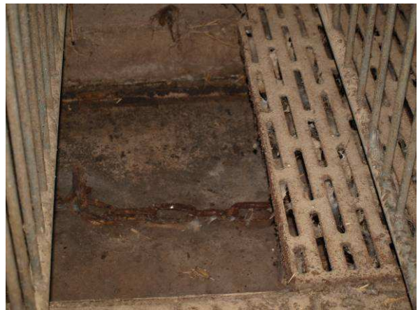
Gülleroste und -kanäle der Ställe im Alten Werkhof ohne Befunde (Februar 2014, März 2015)