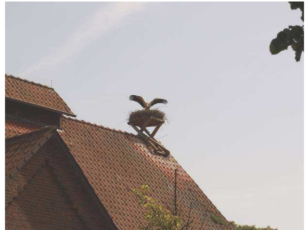
Weißstorch mit Brut – Geb. 16 am Alten Werkhof (bei Hitze im Mai 2014)