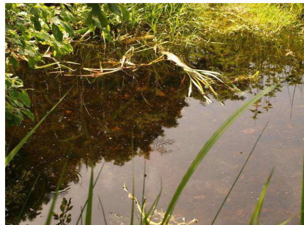
Kleiner Zierteich im Alten Gutshof (Mai 2014)