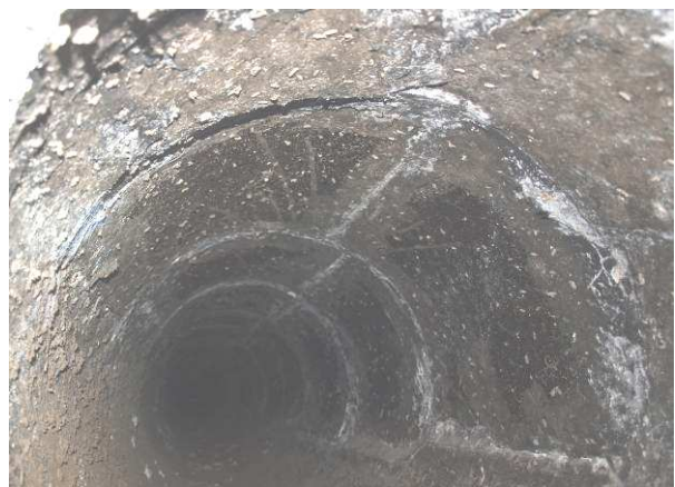
Geöffnetes Lüftungsrohr im Dachboden Gebäude 5 Alter Gutshof - ohne Befund (Februar 2014)