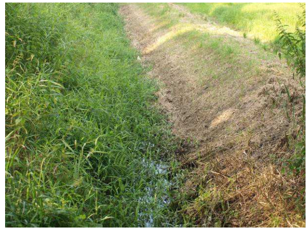
Graben im Norden zum Alten Gutshof (Ende Juni 2014)