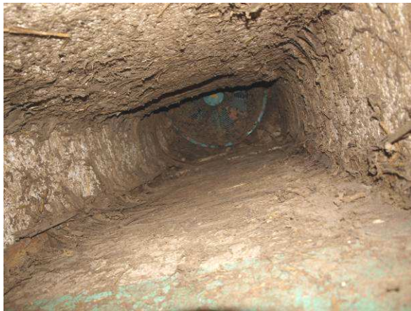
Schornsteine ohne Befund in den Geb. 14, 15 und 16 im Alten Werkhof (2014, 2015)