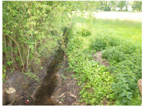
Graben am Ostrand zum Alten Gutshof (Mai 2014)