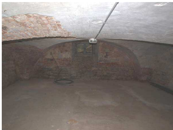
Gewölbekeller hermetisch abgeschlossen - Geb. 33 im Alten Gutshof - ohne Befund (Februar 2014)