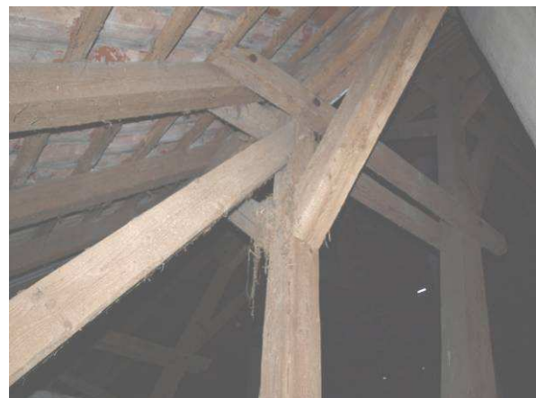
Mögliche Hangplätze im Alten Gutshof werden von Eulen, in einem Fall von Mardern erreicht (2014)