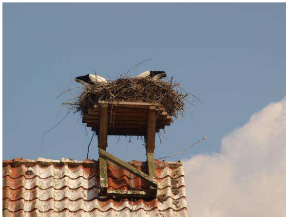
Weißstorchhorst – mit 3 Jungvögeln im Juni 2014