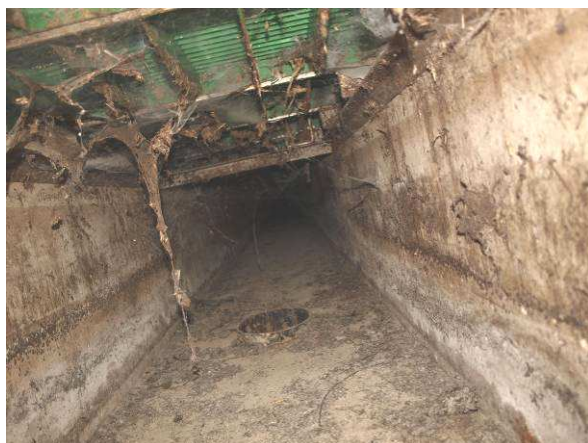
Lüftungschächte am Gebäude 16 ohne Befund (2014),