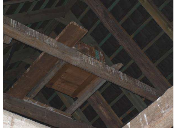
Schleiereulenkasten im Alten Gutshof – Geb. 5 im Jahr 2014 belegt