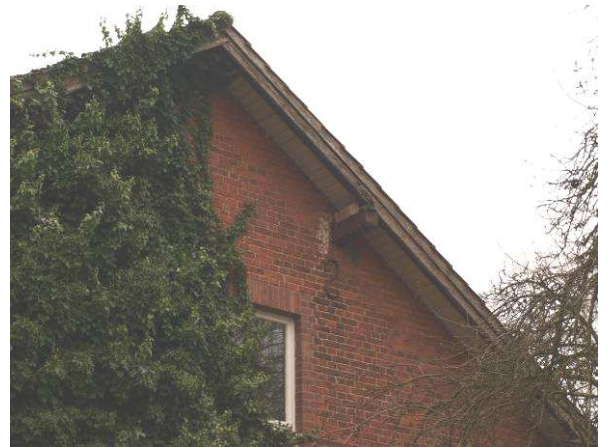
Wohnhaus mit Turmfalkenbrutplatz westlich zum Alten Werkhof – in 2014 nicht belegt