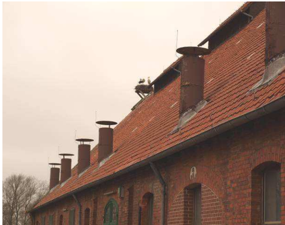
Weißstorch am Alten Werkhof – Geb. 16 (März 2014)