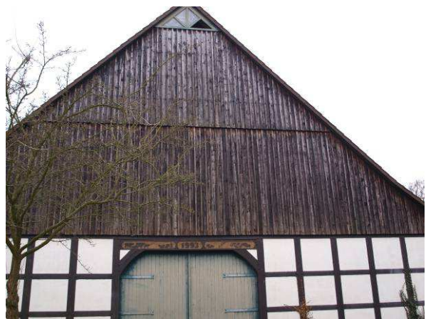
Dachgiebel auch von innen untersucht - Gebäude 5 Alter Gutshof - ohne Befund (Februar 2014)