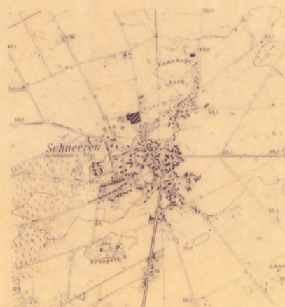
Umgebung des Bebauungsplangebietes

(Ausschnitt aus der Topogr. Karte 1:25000)