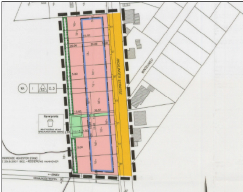
Abbildung 2: Bebauungsplan Nr. 964

Diese Bebauungsplanänderung umfasst einen Teilbereich des seit dem 05.08.2004 rechtskräftigen Bebauungsplanes Nr. 964, dessen Festsetzungen durch die vereinfachte 1. Änderung in diesem Teilbereich mit Rechtskraft außer Kraft treten.