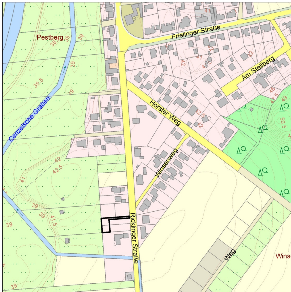
Abbildung 1: Lage des Plangebietes