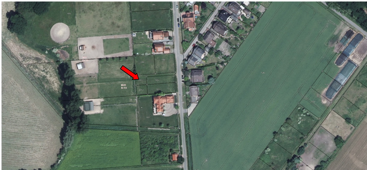
Abbildung 3: Luftbild des Grundstückes