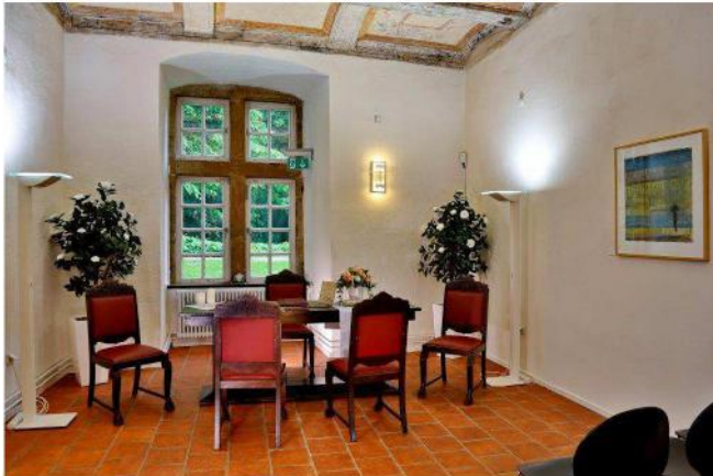
Herzog-Erich Gemach, Region Hannover, 2016

Flanieren Sie mit Ihrer Hochzeitsgesellschaft durch den weitläufigen Amtsgarten. Stoßen Sie mit Ihren Gästen bei gutem Wetter auf den Leineterrassen an oder unter dem grünen Blätterdach der Kastanie im Innenhof.